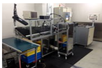
パッケージ捺印・検査機