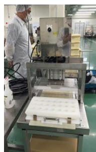
てまり寿司成型機