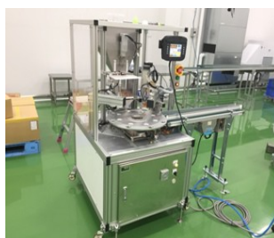
小粒チョコ自動充填機