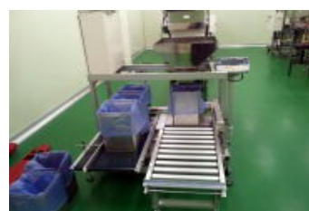
一斗缶用計量充填機