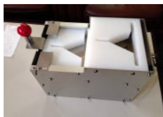
手動式簡易おにぎり包装機