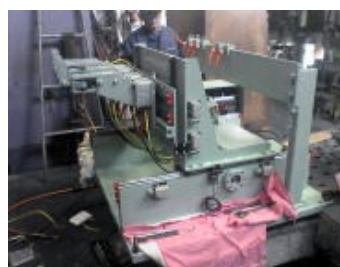
鉄筋溶接ロボット