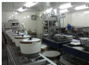
簡易半自動炊飯ライン