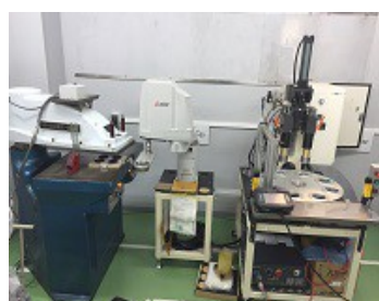
食品カップ製造ロボット